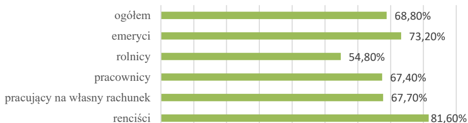
Wykres 2. Udział przeciętnych wydatków w dochodzie rozporządzalnym w 2019 r. (w %)

(wykres 2), jednak pozwala na generowanie pewnych rezerw finansowych. Gospodarstwa seniorów na oszczędności mogą przeznaczyć ok. 27% swoich dochodów rozporządzalnych.